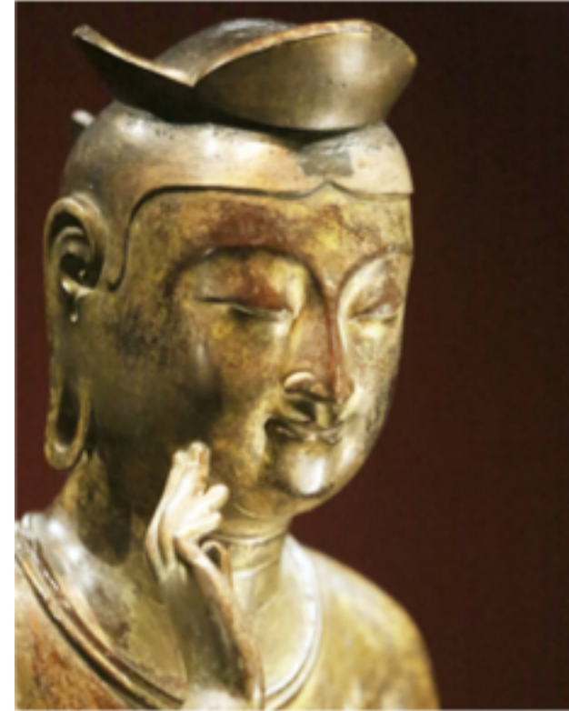
Lächeln im Moment der Erleuchtung?

1. Endzeithoffnungen 2. Maitreya Bodhisattva in Korea 3. Buddhistische Spiritualität 4. Interreligiöse Offerte