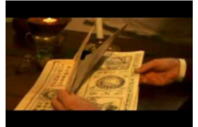
Ausschnitt aus dem Film „The Great Liberation“

1. Endzeithoffnungen 2. Maitreya Bodhisattva in Korea 3. Buddhistische Spiritualität 4. Interreligiöse Offerte