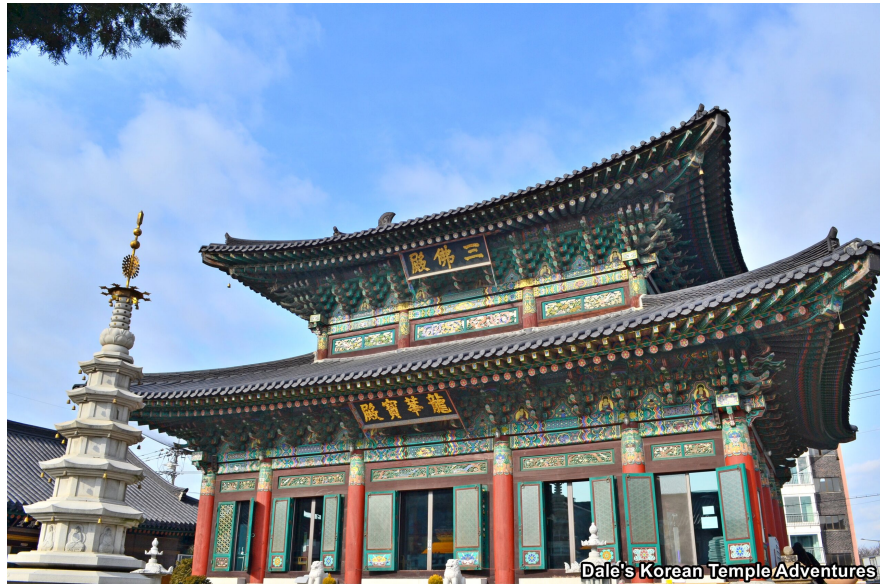
Maitreya Buddha, Yonghwasan Temple