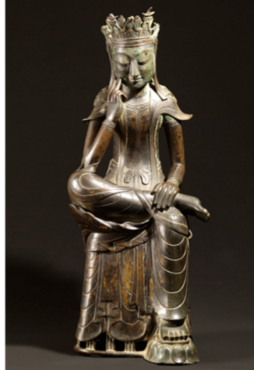
Gilt-bronze Maitreya in Meditation (National Treasure No. 83)

1. Endzeithoffnungen 2. Maitreya Bodhisattva in Korea 3. Buddhistische Spiritualität 4. Interreligiöse Offerte